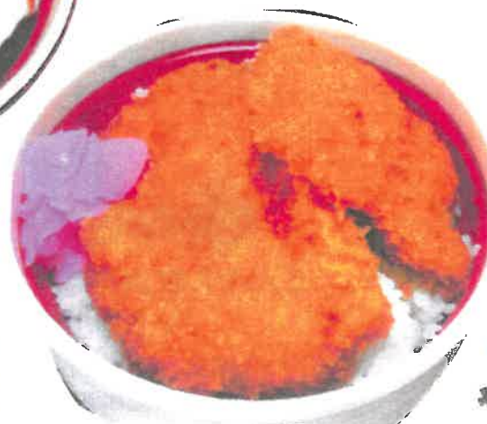
しょむかつ丼 (タレカツ) ¥800円