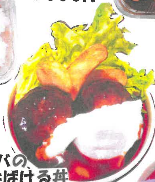
ごっつお重 ¥1600円 (厚切り牛タン)