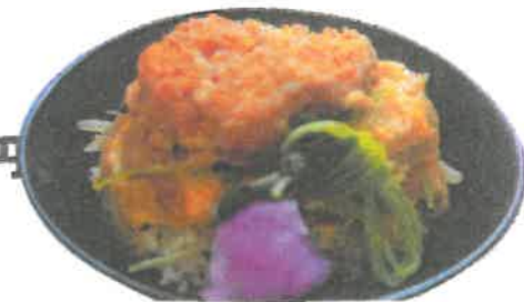
きろみとし丼 ¥800円 (カツ丼)