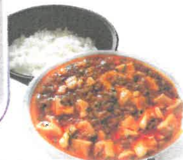
はかいくマーボー (マーボー丼) ¥700円