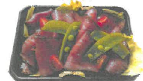
しゃれこき重 ¥1000円 (ローストビーフ重)