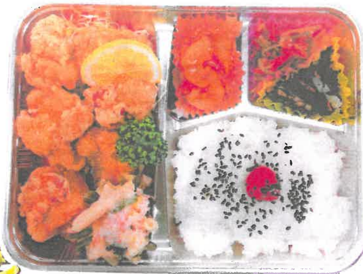
でっかいとり弁 (とりから) ¥850円