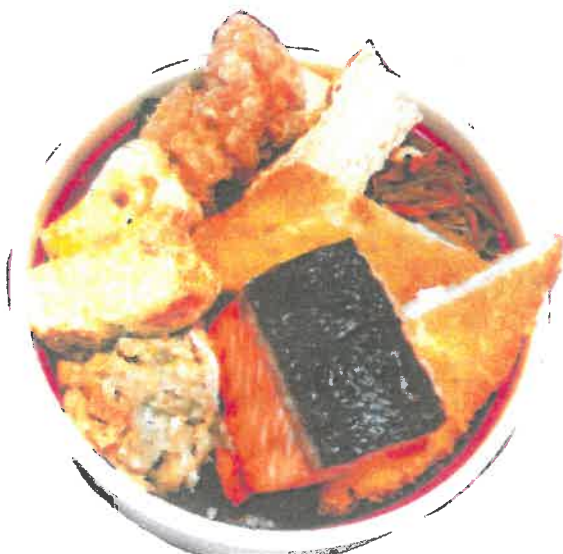
はらくちえ丼 (のり弁風) ¥800円