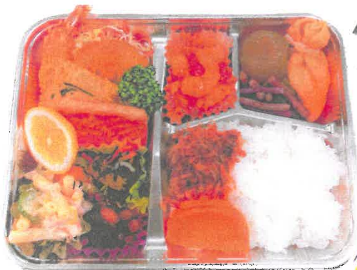
人気No. 1 うんめ弁当 (日替わり) ¥1000円